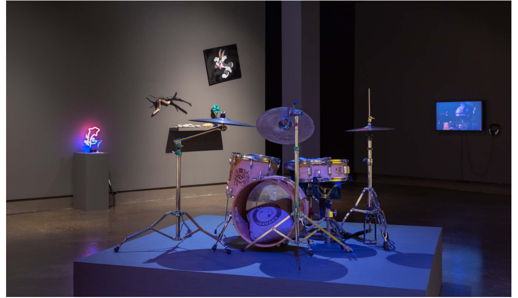
Lisa Lipton, THE IMPOSSIBLE BLUE ROSE , 2016. Installation view / Vue de l'installation. University of Waterloo Art Gallery.