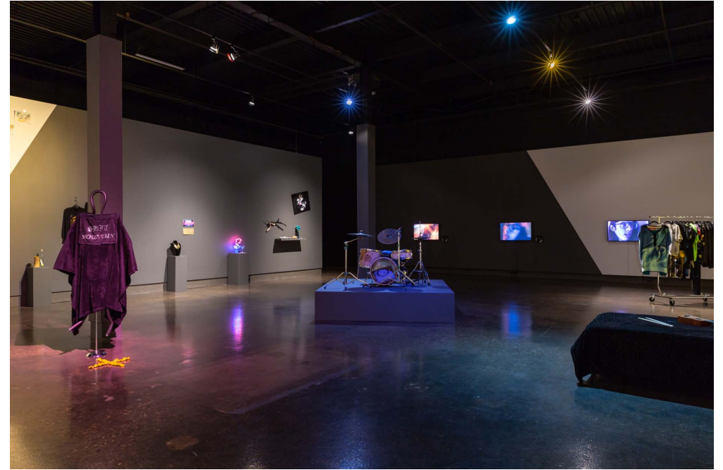
Lisa Lipton, THE IMPOSSIBLE BLUE ROSE , 2016. Installation view / Vue de l'installation. University of Waterloo Art Gallery.