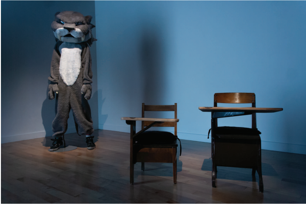
Lisa Lipton, Chapter VI: Greysville, THE IMPOSSIBLE BLUE ROSE , 2014. Installation view / Vue de l'installation. Hamilton Artists Inc.